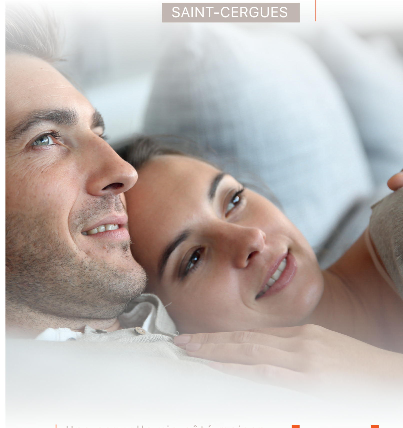
Creation Adiccom / Illustrations non-contractuelles