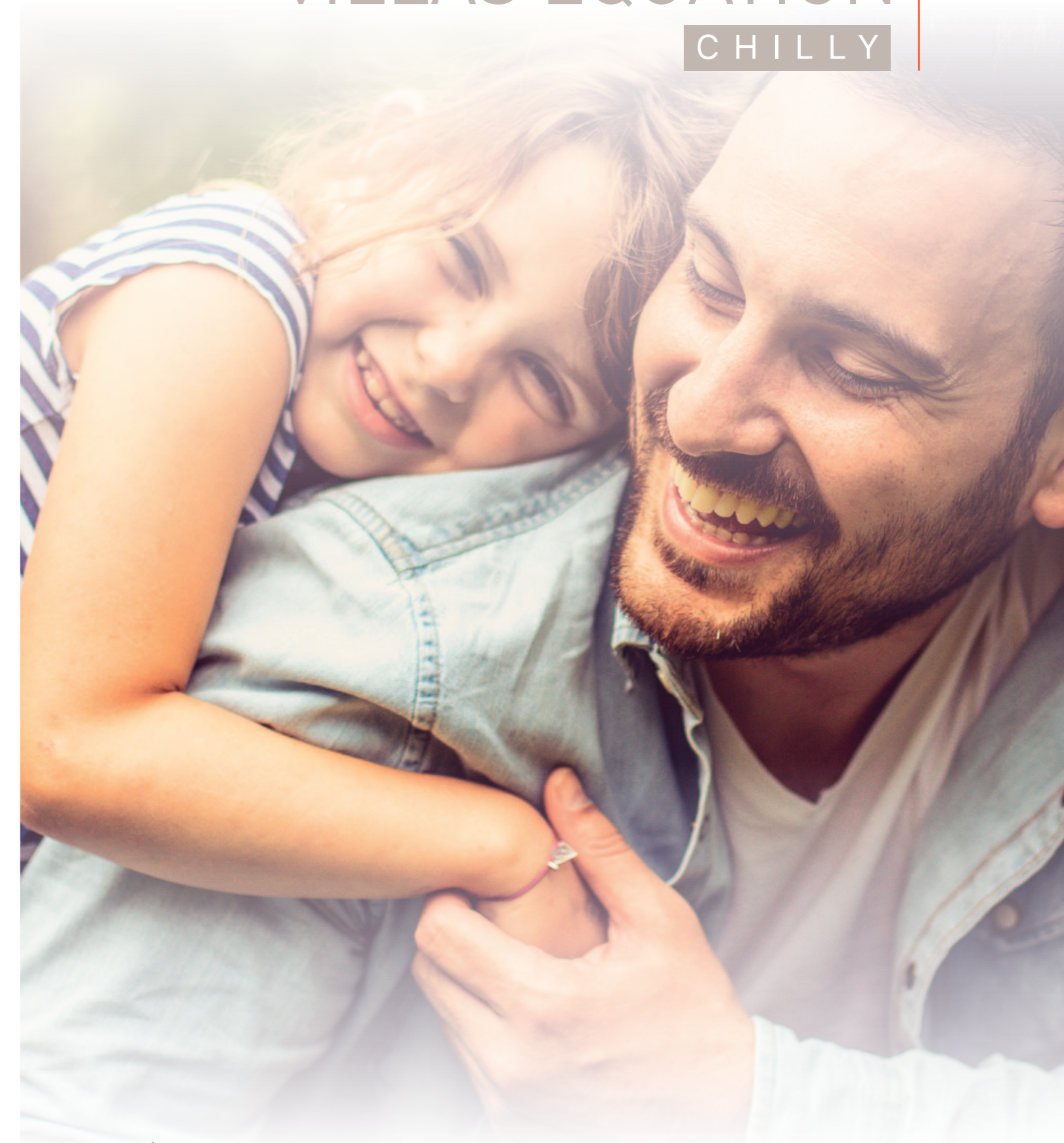
Illustrations non-contractuelles