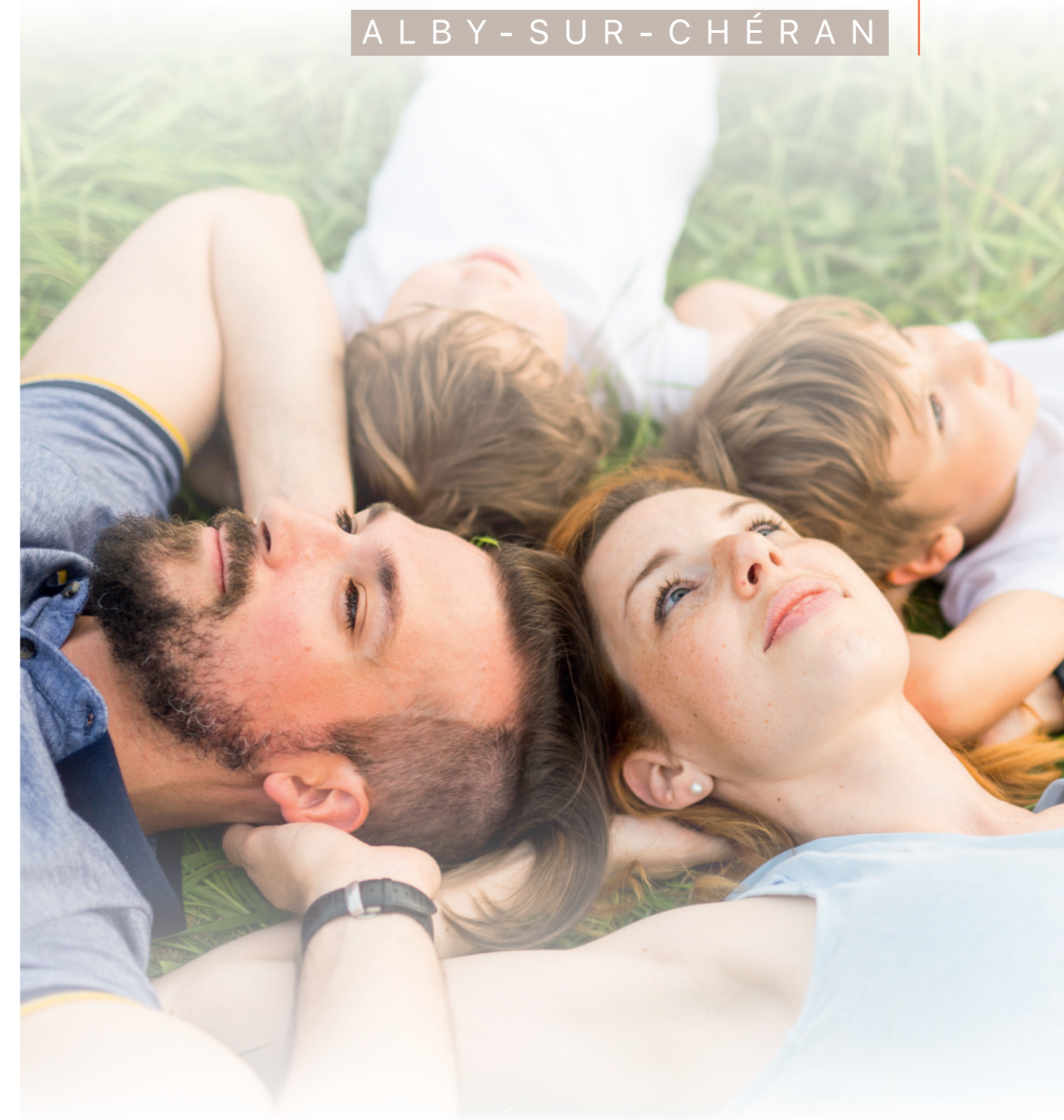
Illustrations non-contractuelles