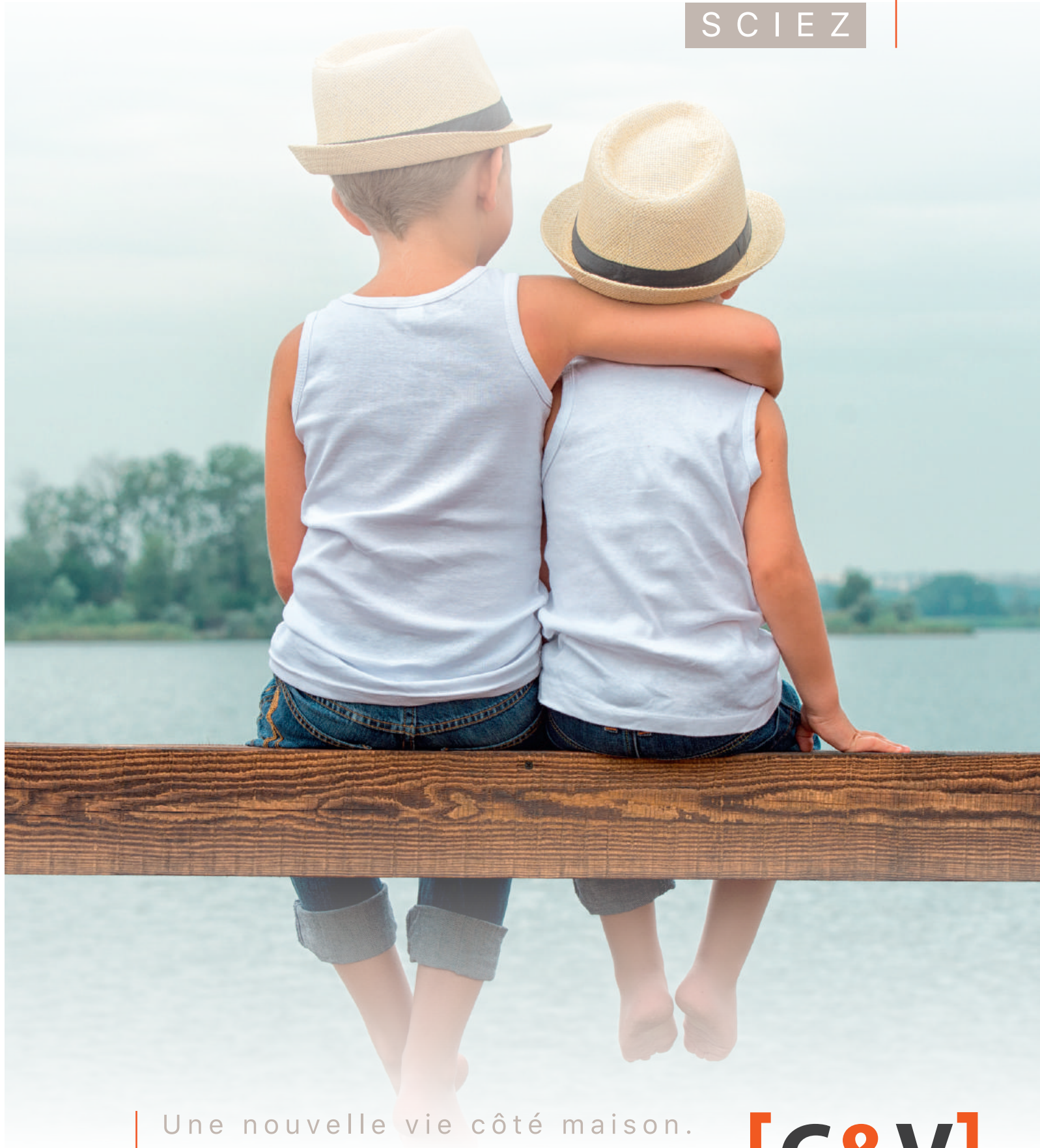
Illustrations non-contractuelles / Credit photos: Fotolia