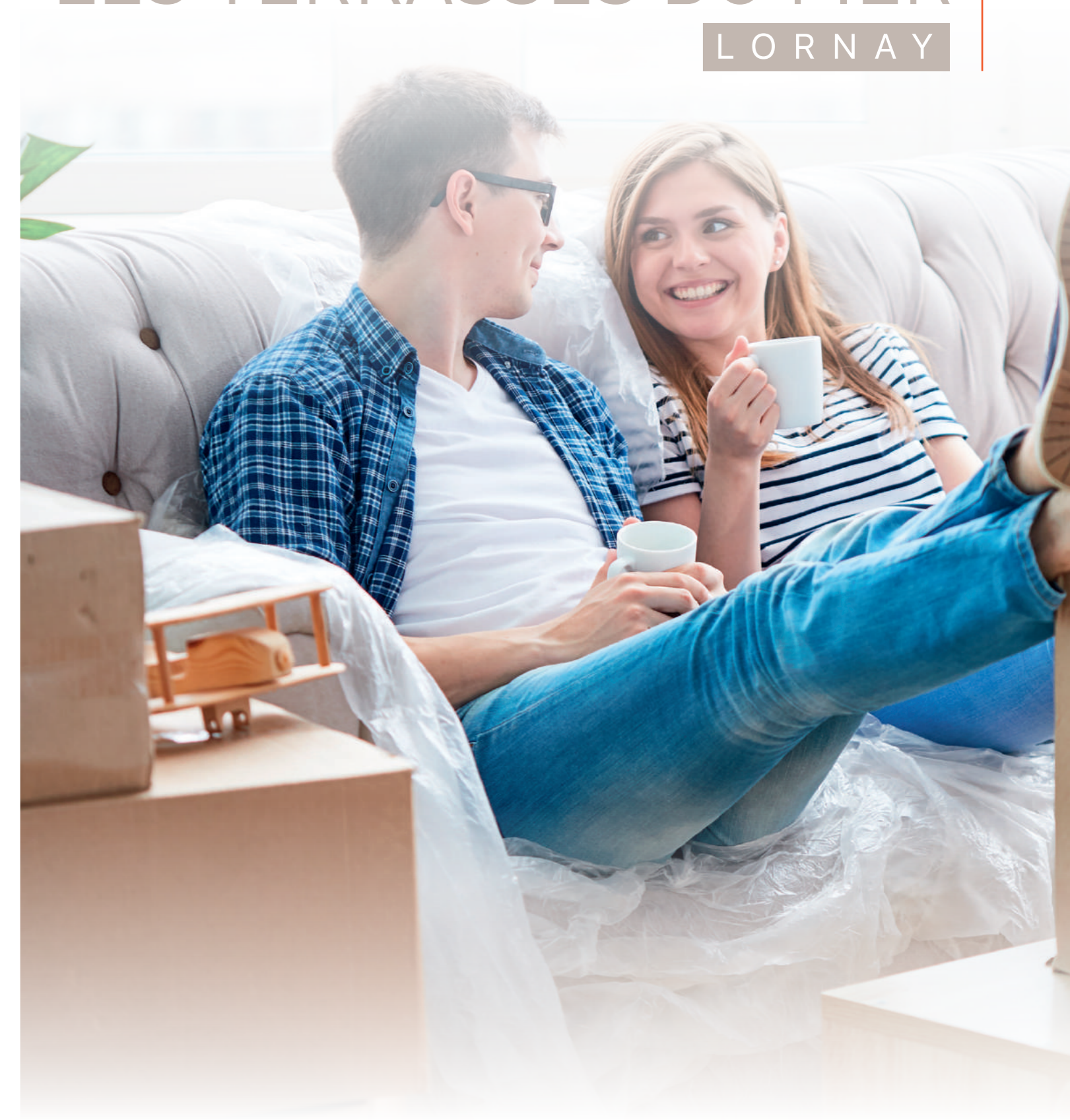
Illustrations non-contractuelles / Crédit photos: Fotolia