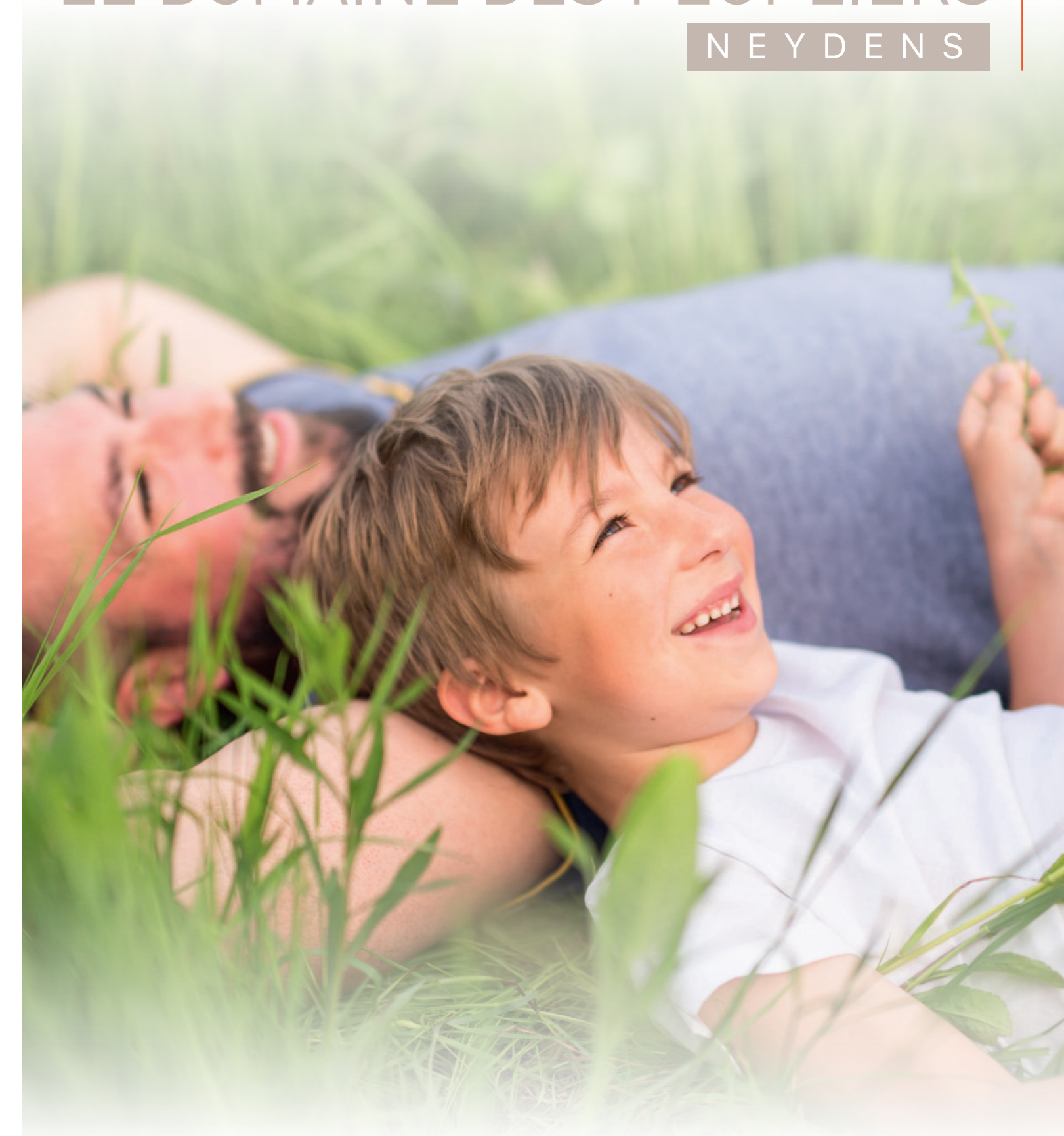
Illustrations non-contractuelles