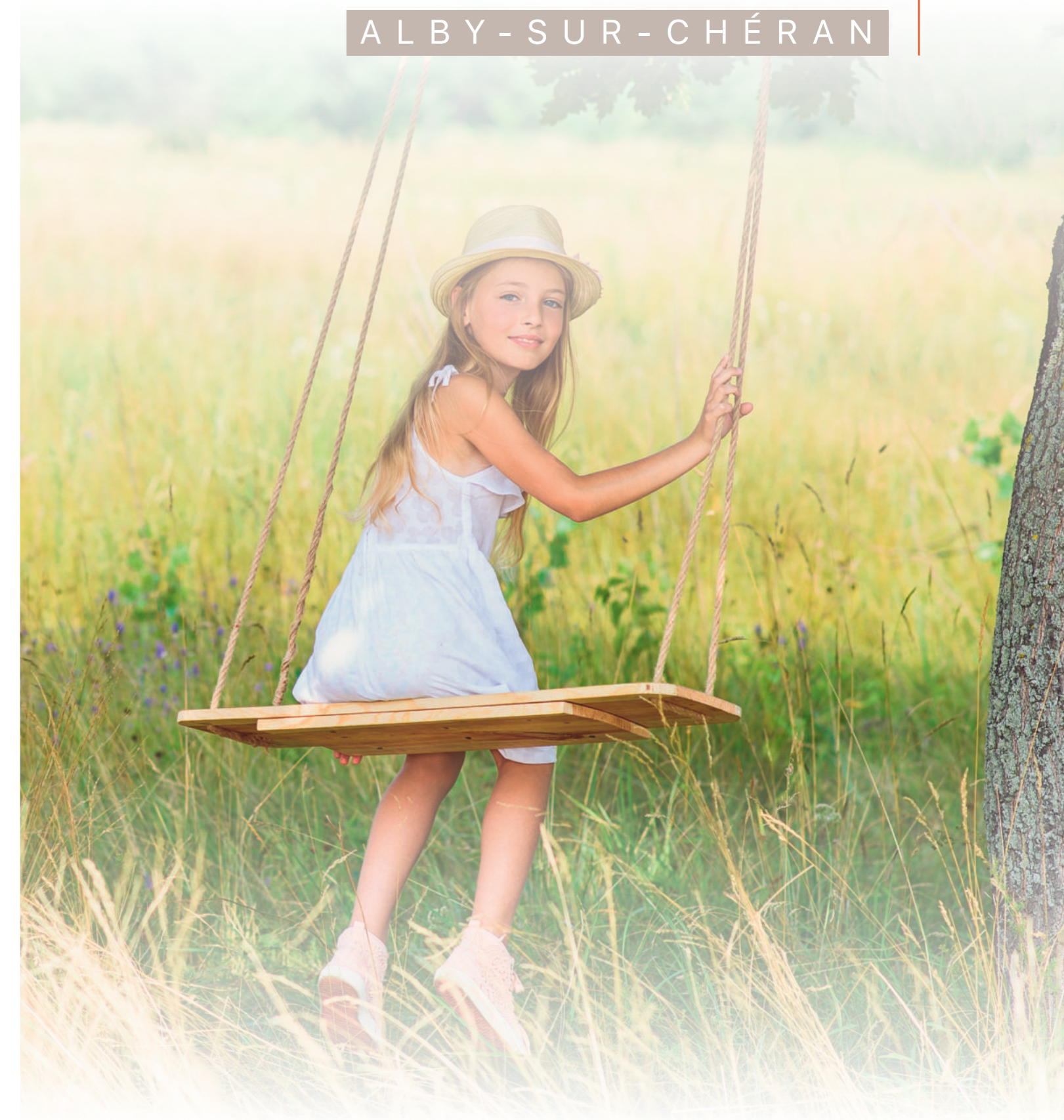
Illustrations non-contractuelles / Crédit photos: Fotolia