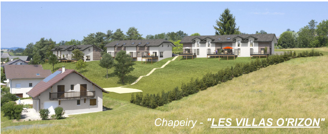
Chapeiry - "LES VILLAS O'RIZON"