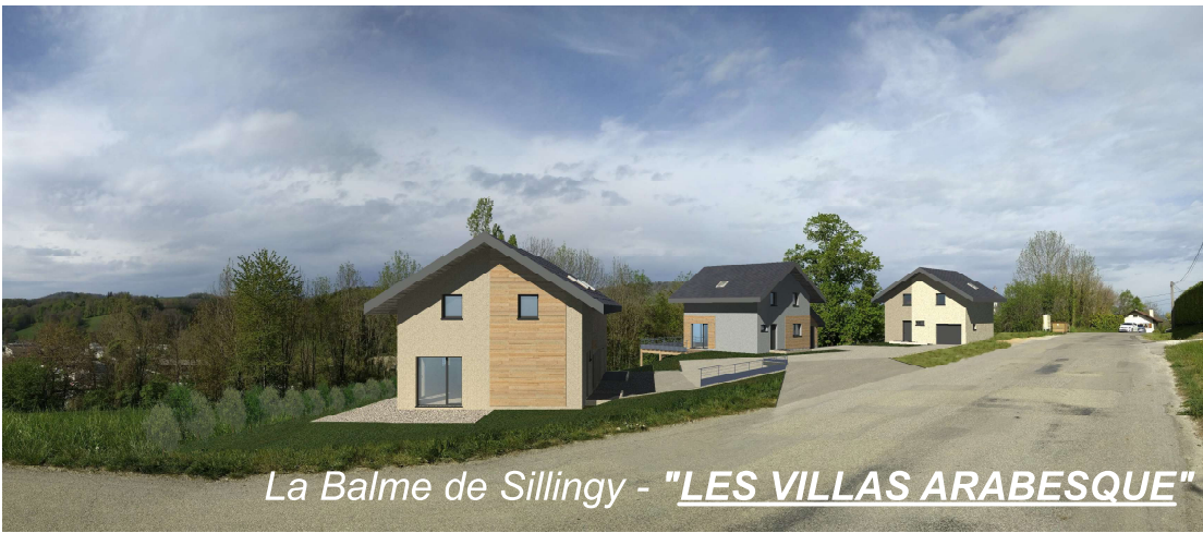
La Balme de Sillingy - "LES VILLAS ARABESQUE"